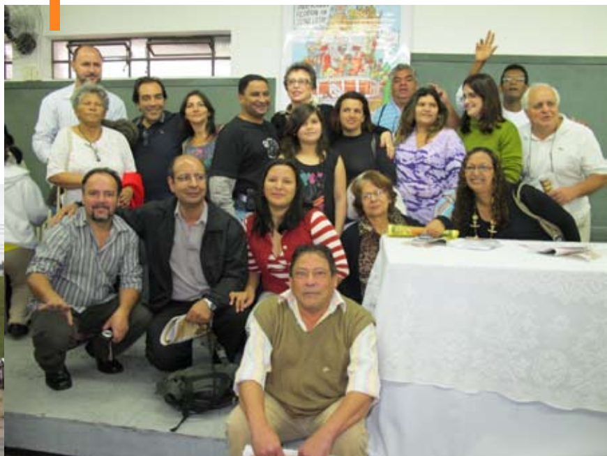
Comunidade da Zona Leste reunida para discutir a implantação da Universidade.